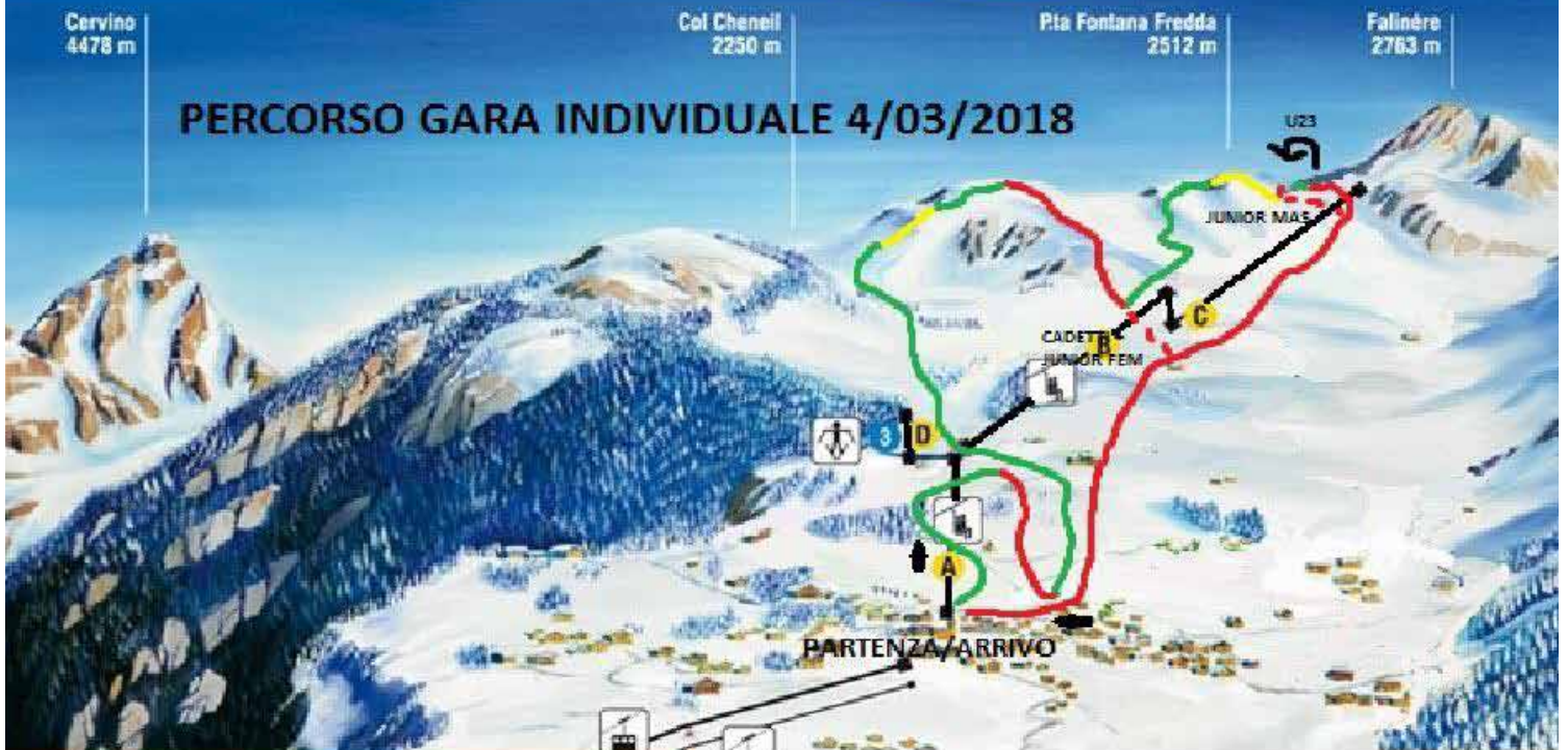
U23 SALITA E DISCESA VERSANTE CHENEIL