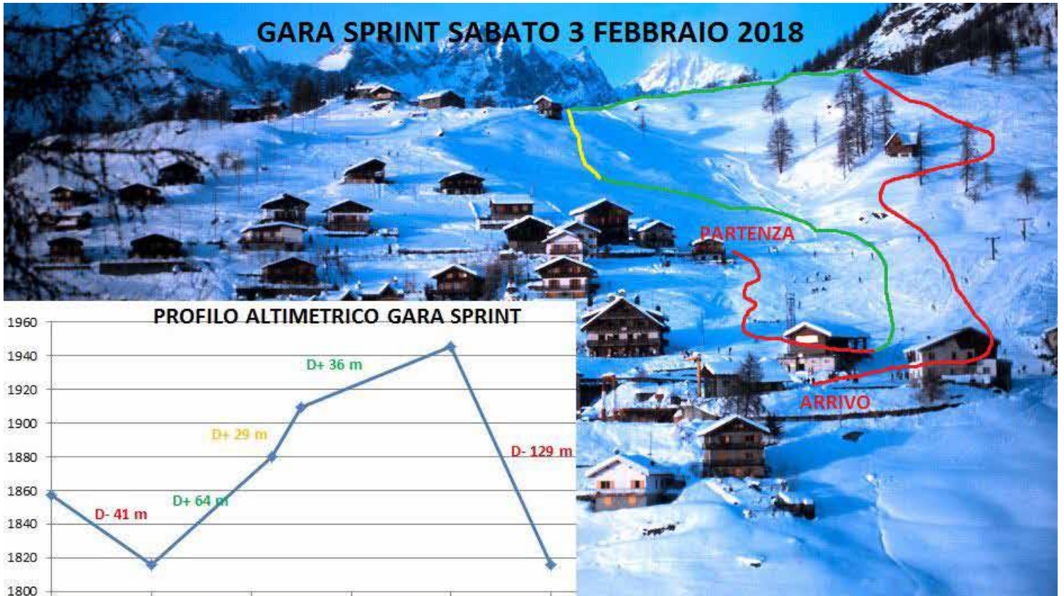
PROFILO ALTIMETRICO GARA SPRINT